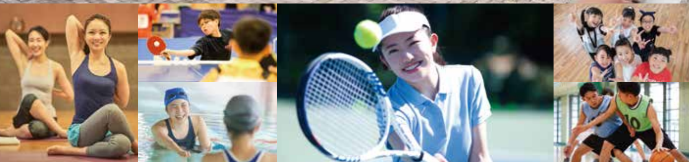
※写真はイメージとなります。

主催：神奈川県スポーツコミュニケーションズ株式会社 運営：ミズノ株式会社、公益財団法人神奈川県スポーツ協会 お問い合わせ 電話：0466-82-7050 FAX：0466-32-9699 窓口：神奈川県立スポーツセンター内グリーンハウス メール：kanagawasc@mizuno.co.jp